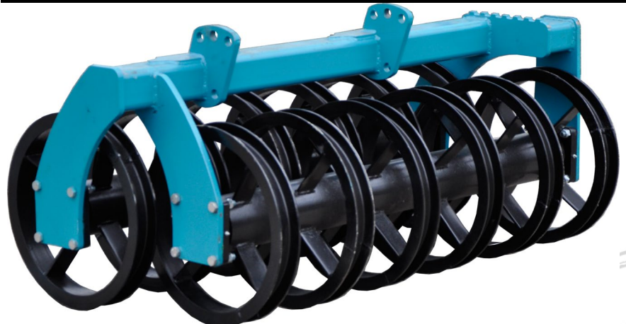
Тяжелый тандемный каток