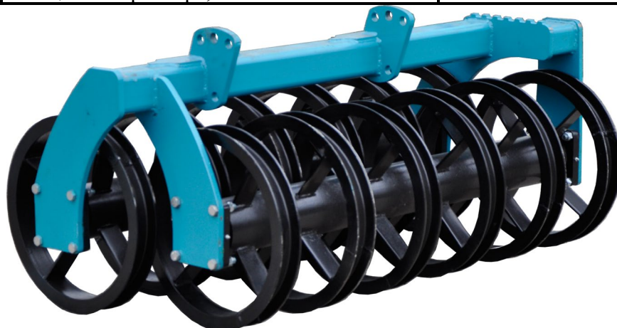
Тяжелый тандемный каток