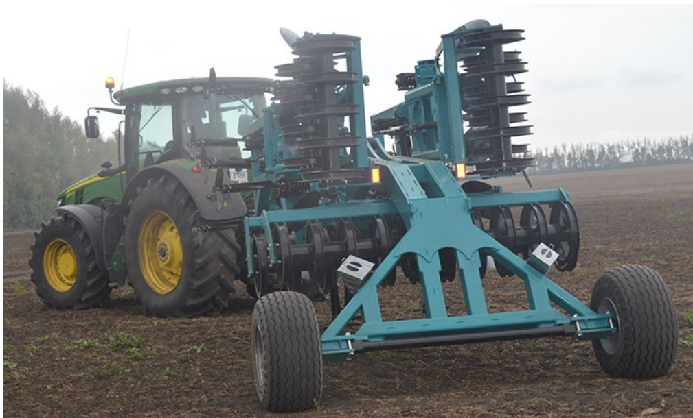
Рабочий орган культиватора с комплектом MulchMix