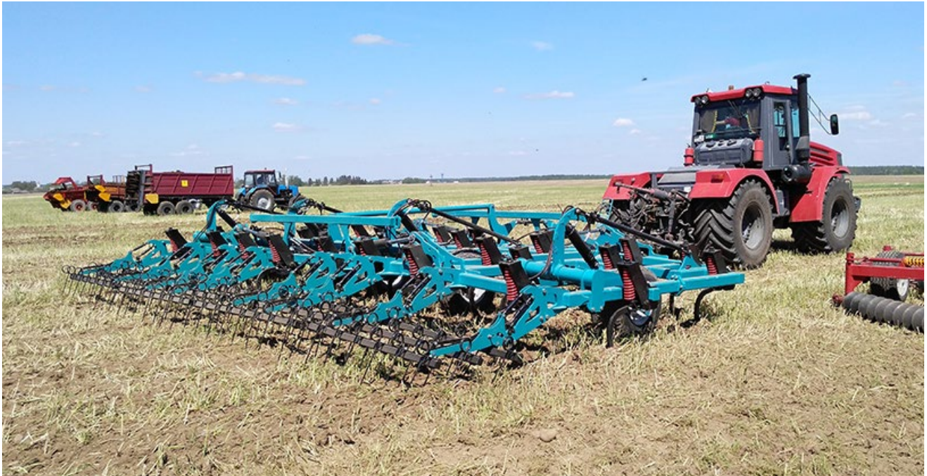
Рабочий орган культиватора